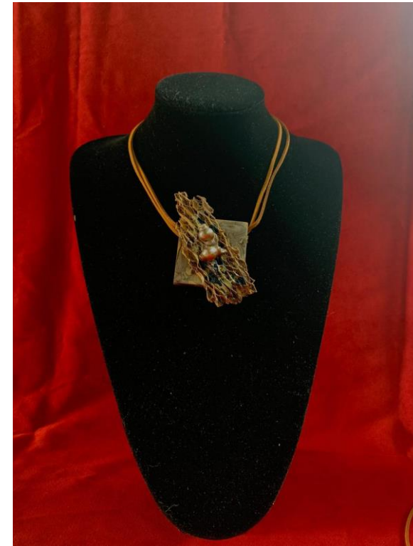
Collezione «Linea Geometrie»

Gioielli realizzati in legno, cuoio e pietre semipreziose